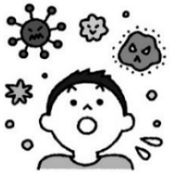
ウイルスに かんぜん 感染しやすくなる