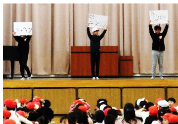
給食委員がクイズをだしています

1月15日(火)に給食委員主催の児童朝会が行われました。給食委員のみなさんが給食に関するクイズを用意して給食の大切さについて全校児童に楽しく説明してくれました。その後、調理員さんの代表の方へお礼の手紙を読んでもくれました。毎日当たり前のように出てくる給食ですが、子どもたちの成長に合わせて、栄養やバランスを考えた献立を作り、たくさん食べてもらうために少しでもおいしいものにしようと一生懸命に作ってくれています。