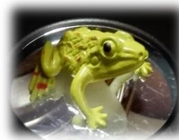
飛び出すカエルです!

先日、校長室のドアに『飛び出すカエルが見たい人は、校長先生に声を掛けてください。(さわれないけど、さわれます?)』と張り紙をしました。気が付いた児童が、校長室のドアをノックして、「□年△組の〇〇です。飛び出すカエルを見せてください。」(東大成小の児童は、礼儀がしっかりできています。)と訪ねて来てくれます。カエルが台の上に飛び出しているように見えるのですが、指でカエルに触ろうとすると触れないのです。カエルをお金に換えてやってみるとこれまた楽しめます。実はたねも仕掛けもあるのですが、何度見ても不思議です。百聞は一見に如かず。「不思議だな!」「おもしろいな!」「どうなってるんだろう?」という好奇心を持つことは、自ら学習に取り組むことの大きな原動力になります。学校に来られた保護者や地域の方も気軽にお声掛け頂きまして、カエルでもお金でもお好きなものを触って(!?)みてください。